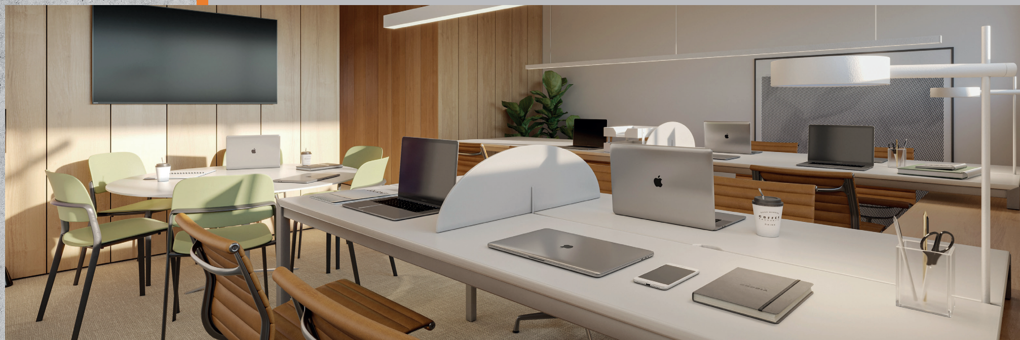
Sala comercial de 74m 2