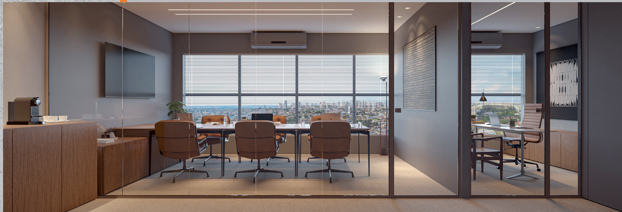
Sala comercial de 42,7m 2